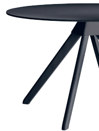
Frame: Beech painted Black Joint: Black 1754 C Top: Black 8510