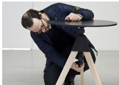
Designer bei Magis