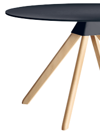
Frame: Natural Beech Joint: Black 1754 C Top: Black 8510