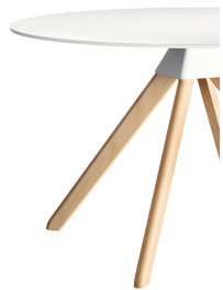
Frame: Natural Beech Joint: White 1735 C Top: White 8500