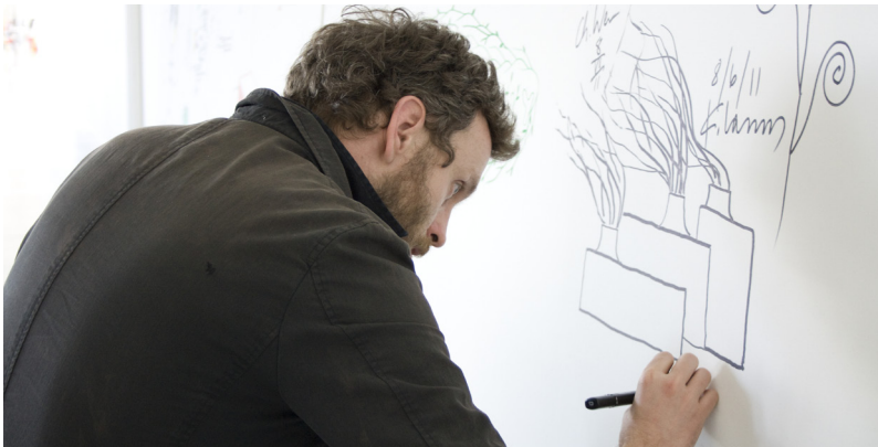
Designer bei Magis