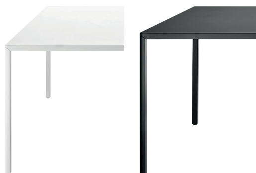
Finish White 5115