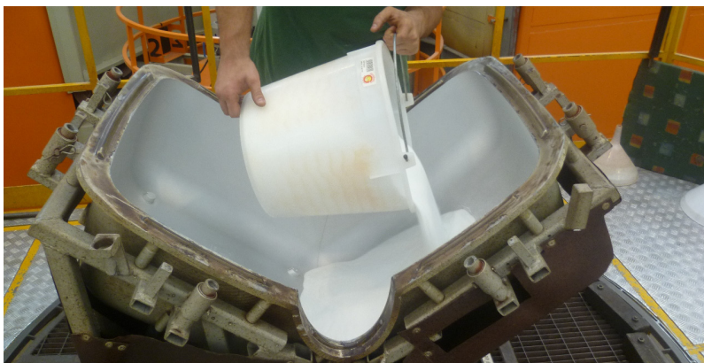
Proceso de producción y diseñador en Magis

Antes de llegar al producto definitivo, lanzado en el mercado en 2009, se dedicaron muchos años de estudio al desarrollo de la butaca Nimrod. El objetivo inicial de Magis era el de realizar este producto con la aplicación de la tecnología del blow-moulding, pero después de numerosos tentativos para lograr ese grado de calidad técnica al que Magis siempre anhela, se abandonó esta dirección para orientarse hacia la tecnología del moldeo rotacional, que ha determinado una definición estética más precisa del objeto.