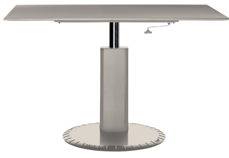
Matt colour Light Grey 1707 C