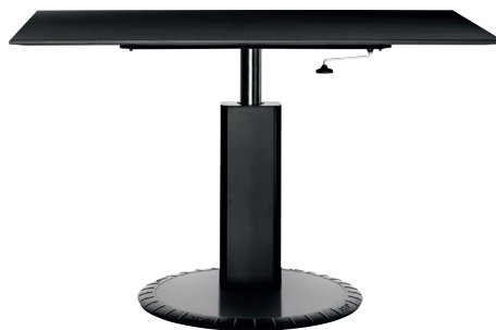
Matt colour Black 1764 C