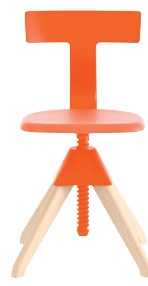
Legs: Natural Beech Seat: Beech painted Orange Back + Joint: Orange 1780 C