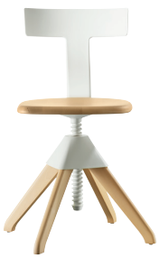
Seat + Frame: Natural beech Back + Joint: White 1735 C