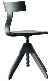
Seat + Frame: Beech painted Black Back + Joint: Black 1754 C