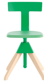
Legs: Natural Beech Seat: Beech painted Green Back + Joint: Green 1783 C