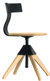
Seat + Frame: Natural beech Back + Joint: Black 1754 C