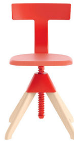
Legs: Natural Beech Seat: Beech painted Red Back + Joint: Red 1782 C