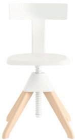
Legs: Natural Beech Seat: Beech painted White Back + Joint: White 1735 C