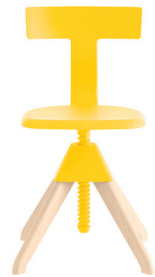
Legs: Natural Beech Seat: Beech painted Yellow Back + Joint: Yellow 1784 C