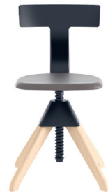
Legs: Natural Beech Seat: Beech painted Black Back + Joint: Black 1754 C