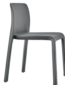
Colour Grey Mélange F-509