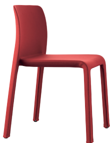
Colour Dark Red F-127