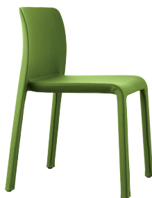
Colour Green Mélange F-352