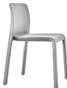
Colour Light Grey Mélange F-506