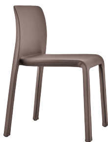
Colour Brown Mélange F-518