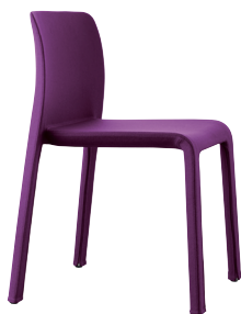
Colour Purple F-490