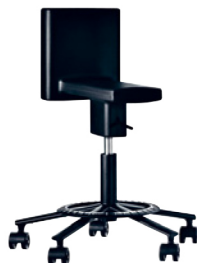
Matt colour Black 1764 C