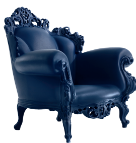
Matt color Blue 1192 C