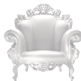
Matt color White 1735 C