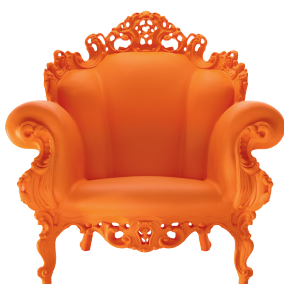
Matt color Orange 1087 C