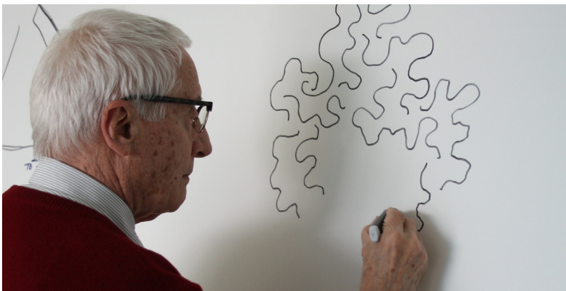
Diseñador en Magis