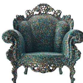
Matt color Multicolor