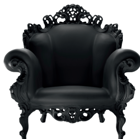
Matt color Black 1754 C