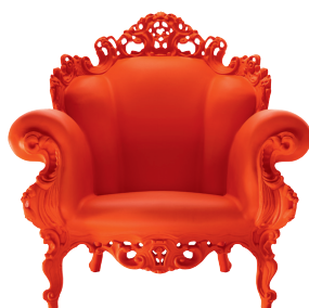
Matt color Red 1114 C