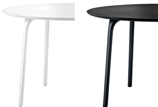
Legs: White 1735 C Top: White 8500