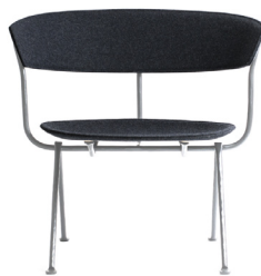
Frame: Galvanized Seat and Back: Dark Grey Divina MD (193)