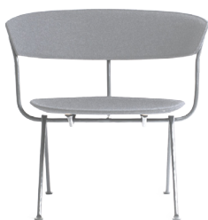
Frame: Galvanized Seat and Back: Light Grey Divina Mélange 120