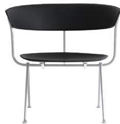
Frame: Galvanized Seat and Back: Black Leather L-0060