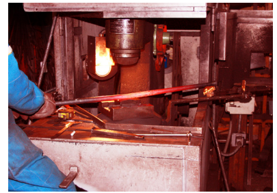
Processo di produzione