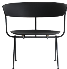
Frame: Black Seat and Back: Black Leather L-0060