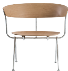
Frame: Galvanized Seat and Back: Natural Beech