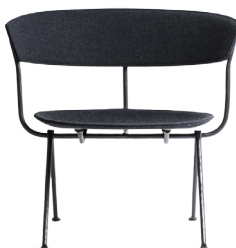
Frame: Black Seat and Back: Dark Grey Divina MD (193)