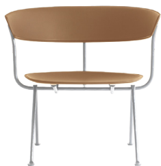
Frame: Galvanized Seat and Back: Natural Leather L-0090