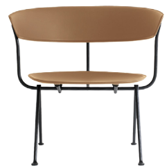
Frame: Black Seat and Back: Natural Leather L-0090