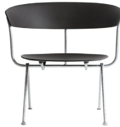
Frame: Galvanized Seat and Back: Black Beech