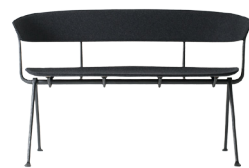
Frame: Black Seat and Back: Dark Grey Divina MD (193)