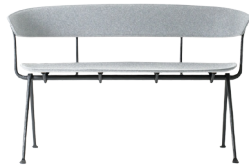
Frame: Black Seat and Back: Light Grey Divina Mélange 120