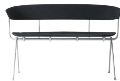
Frame: Galvanized Seat and Back: Dark Grey Divina MD (193)