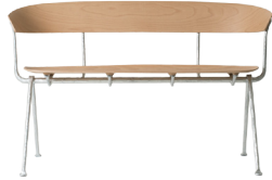
Frame: Galvanized Seat and Back: Natural Beech