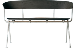
Frame: Galvanized Seat and Back: Black Beech