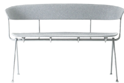
Frame: Galvanized Seat and Back: Light Grey Divina Mélange 120