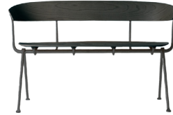
Frame: Black Seat and Back: Black Beech