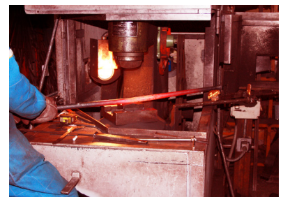
Processo di produzione