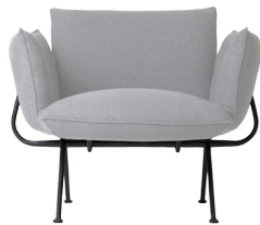
Frame: Black Cushions: Light Grey Divina Mélange 120