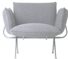
Frame: Galvanized Cushions: Light Grey Divina Mélange 120