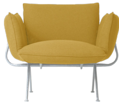
Frame: Galvanized Cushions: Ochre Azimut 400