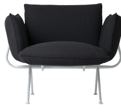
Frame: Galvanized Cushions: Dark Grey Rico 989.070