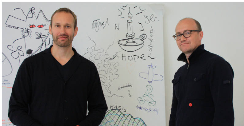
Designers in Magis