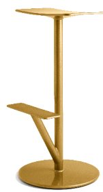
Matt colour Ocher