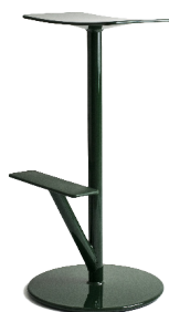
Matt colour Dark Green