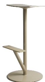
Matt colour White