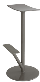
Matt colour Metallised Grey