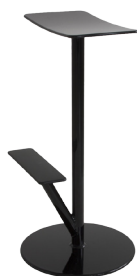
Matt colour Black