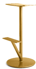
Matt colour Ocher