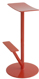
Matt colour Coral Red