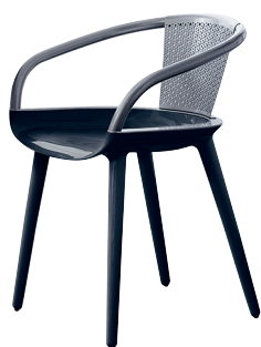
Frame: Glossy Black 1763 C Back: Dark Grey "gun metal"