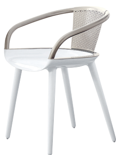
Frame: Glossy White 1736 C Back: Beige "champagne"