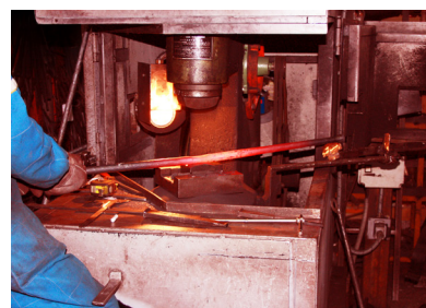
Processo di produzione