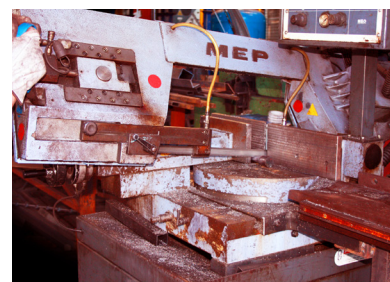
Processo di produzione