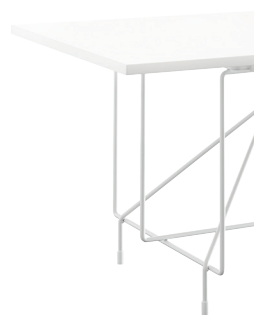
Frame: White 5108 Top: White 8500