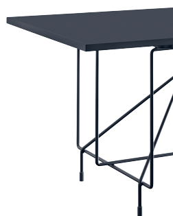
Frame: Black 5140 Top: Black 8510