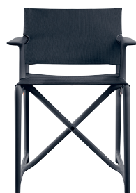
Frame: Black 1765 C Seat + Back: Black F-758