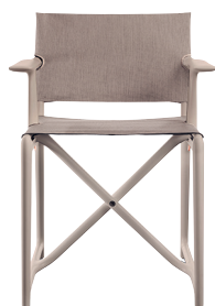
Frame: Beige 1733 C Seat + Back: Beige F-458