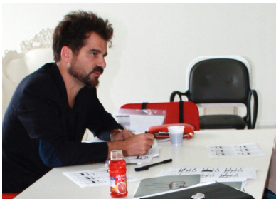
Designer in Magis