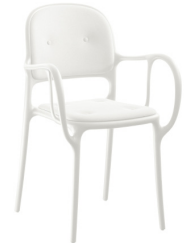
Matt colour White 1738 C Cushions: KingLKat white F-739