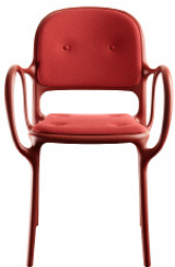
Matt colour Red 1484 C Cushions: KingLKat red F-130