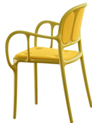
Matt colour Yellow 1666 C Cushions: KingLKat yellow F-579