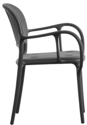
Matt colour Black 1769 C Cushions: KingL black F-198