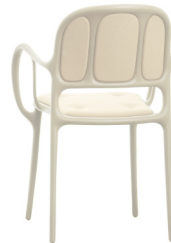
Matt colour Beige 1733 C Cushions: KingLKat beige F-459