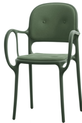
Matt colour Dark Green 1556 C Cushions: KingL green F-359