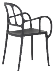
Matt colour Black 1769 C