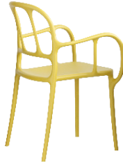
Matt colour Yellow 1666 C