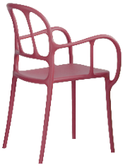
Matt colour Red 1484 C