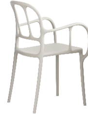
Matt colour Beige 1733 C