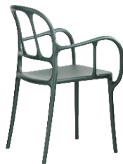
Matt colour Dark Green 1556 C