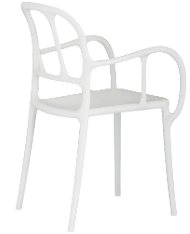
Matt colour White 1738 C