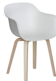
Frame: Natural Ash Seat: White 1735 C