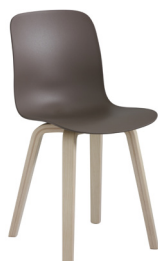
Frame: Natural Ash Seat: Beige 1452 C