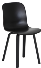
Frame: Ash painted black Seat: Black L-0060