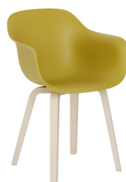
Frame: Natural Ash Seat: Mustard 1015 C