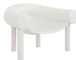
Matt colour White 1735 C