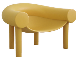
Matt colour Curry 1014 C