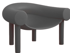
Matt colour Grey Anthracite 1429 C