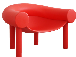
Matt colour Red 1004 C