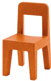
Matt colour Orange 1082 C