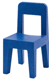
Matt colour Blue 1606 C