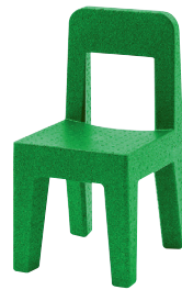
Matt colour Green 1638 C