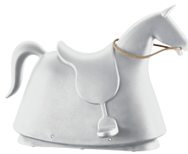
Matt colour White 1736 C