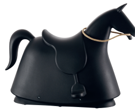
Matt colour Black 1768 C