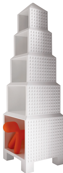
Matt colour White 1736 C