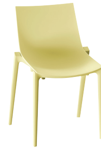
Zartan Basic Light Yellow 1567 C