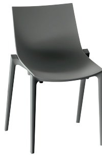
Zartan Basic Dark Grey 1426 C