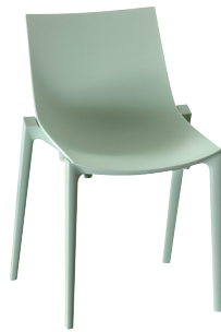
Zartan Basic Light Green 1327 C