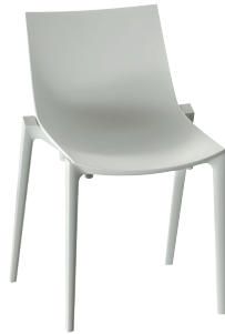
Zartan Basic Light Grey 1709 C