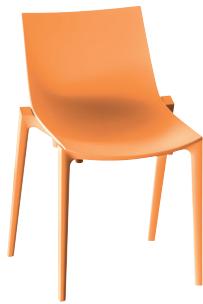
Zartan Basic Orange 1054 C