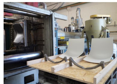
Processus de production