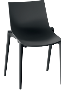
Zartan Basic Black 1768 C