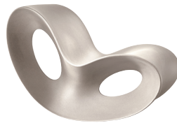
Outdoor use Matt colour: Light Grey 1395 C