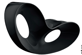
Indoor use Glossy colour: Black 1763 C