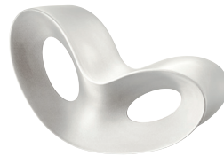
Outdoor use Matt colour: White 1736 C