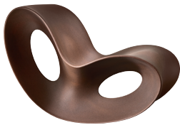
Outdoor use Matt colour: Rust Brown 1069 C