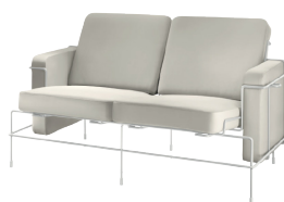
Frame: White 5011 Leather: Cream White L-0707 Tablet: White