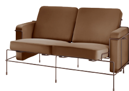
Frame: Sepia Brown 5016 Leather: Brown L-0112 Tablet: Anthracite Grey