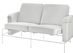
Frame: White 5011 Fabric: White F-737 Tablet: White