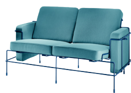
Frame: Green Blue 5017 Fabric: Light Blue F-222 (983) Tablet: White