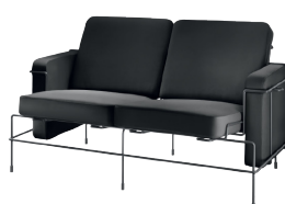
Frame: Black 5013 Leather: Anthracite Grey L-0065 Tablet: Anthracite Grey