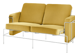
Frame: White 5011 Fabric: Yellow F-578 (453) Tablet: White