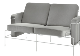
Frame: White 5011 Fabric: Light Grey F-741 (133) Tablet: White