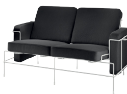
Frame: White 5011 Fabric: Black F-769 Tablet: White