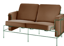
Frame: Dark Green 5021 Leather: Brown L-0112 Tablet: Dark Green