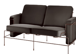
Frame: Sepia Brown 5016 Leather: Dark Brown L-0753 Tablet: Anthracite Grey