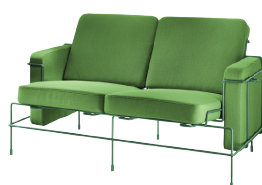
Frame: Dark Green 5021 Fabric: Green F-354 (953) Tablet: Dark Green