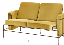
Frame: Sepia Brown 5016 Fabric: Yellow F-578 (453) Tablet: Anthracite Grey