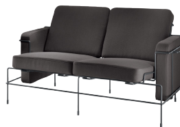
Frame: Black 5013 Fabric: Dark Brown F-521 (383) Tablet: Anthracite Grey