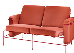
Frame: Signal Red 5019 Fabric: Orange F-088 (533) Tablet: Anthracite Grey