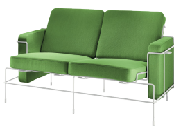
Frame: White 5011 Fabric: Green F-354 (953) Tablet: White