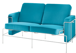
Frame: White 5011 Fabric: Turquoise F-227 Tablet: White