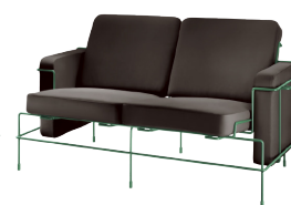
Frame: Dark Green 5021 Leather: Dark Brown L-0753 Tablet: Dark Green