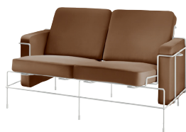
Frame: White 5011 Leather: Brown L-0112 Tablet: White