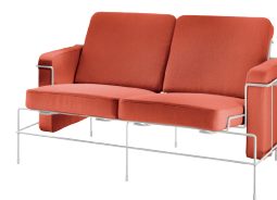
Frame: White 5011 Fabric: Orange F-088 (533) Tablet: White