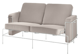
Frame: White 5011 Fabric: Beige F-266 (205) Tablet: White