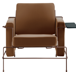
Frame: Sepia Brown 5016 Leather: Brown L-0111 Tablet: Anthracite Grey