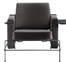
Frame: Black 5013 Fabric: Dark Brown F-521 (383) Tablet: Anthracite Grey