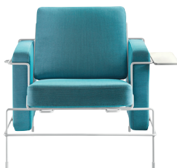
Frame: White 5011 Fabric: Light Blue F-222 (983) Tablet: White