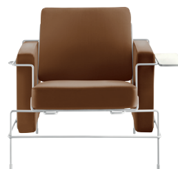
Frame: White 5011 Leather: Brown L-0111 Tablet: White