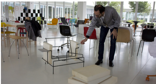
Designer in Magis

divano a due e a tre posti, una panca in due versioni, una chaise longue e un'isola. Alla collezione si sono aggiunti inoltre anche due tavolini bassi, uno grande ed uno piccolo, ed un tavolino alto, sempre con struttura in tondino metallico ma con il piano realizzato in pietra artificiale: un'ulteriore sensazione materica che si aggiunge al panorama domestico o contract.