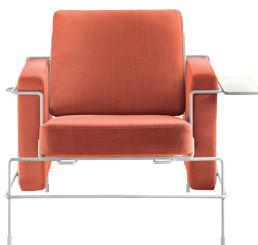
Frame: White 5011 Fabric: Orange F-088 (533) Tablet: White