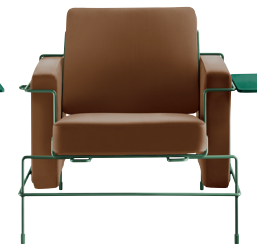
Frame: Dark Green 5021 Leather: Brown L-0111 Tablet: Dark Green