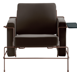
Frame: Sepia Brown 5016 Leather: Dark Brown L-0752 Tablet: Anthracite Grey