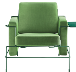
Frame: Dark Green 5021 Fabric: Green F-354 (953) Tablet: Dark Green