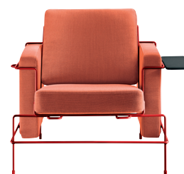
Frame: Signal Red 5019 Fabric: Orange F-088 (533) Tablet: Anthracite Grey