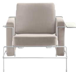
Frame: White 5011 Fabric: Beige F-266 (205) Tablet: White