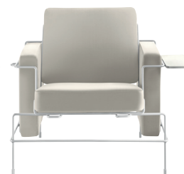
Frame: White 5011 Leather: Cream White L-0706 Tablet: White