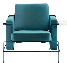
Frame: Green Blue 5017 Fabric: Light Blue F-222 (983) Tablet: White