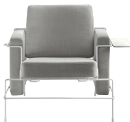
Frame: White 5011 Fabric: Light Grey F-741 (133) Tablet: White