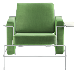
Frame: White 5011 Fabric: Green F-354 (953) Tablet: White