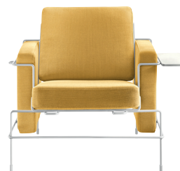
Frame: White 5011 Fabric: Yellow F-578 (453) Tablet: White