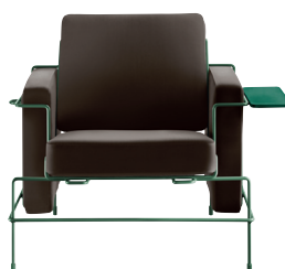
Frame: Dark Green 5021 Leather: Dark Brown L-0752 Tablet: Dark Green