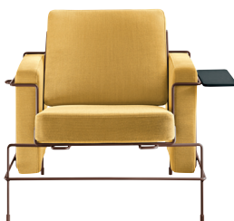
Frame: Sepia Brown 5016 Fabric: Yellow F-578 (453) Tablet: Anthracite Grey