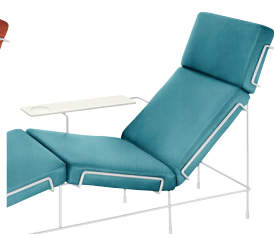
Frame: White 5011 Fabric: Light Blue F-222 (983) Tablet: White