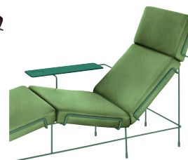
Frame: Dark Green 5021 Fabric: Green F-354 (953) Tablet: Dark Green