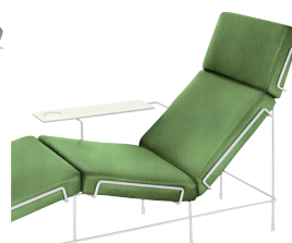
Frame: White 5011 Fabric: Green F-354 (953) Tablet: White