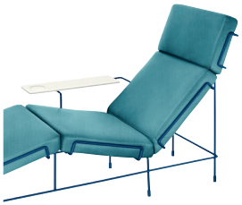
Frame: Green Blue 5017 Fabric: Light Blue F-222 (983)