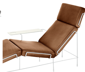
Frame: White 5011 Leather: Brown L-0112 Tablet: White