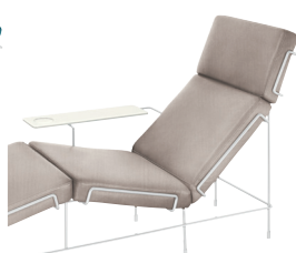
Frame: White 5011 Fabric: Beige F-266 (205) Tablet: White