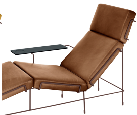
Frame: Sepia Brown 5016 Leather: Brown L-0112 Tablet: Anthracite Grey