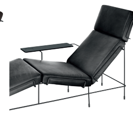
Frame: Black 5013 Leather: Anthracite Grey L-0065 Tablet: Anthracite Grey