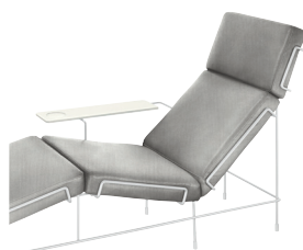
Frame: White 5011 Fabric: Light Grey F-741 (133) Tablet: White