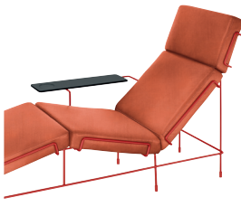
Frame: Signal Red 5019 Fabric: Orange F-088 (533) Tablet: Anthracite Grey