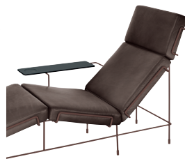
Frame: Sepia Brown 5016 Leather: Dark Brown L-0753 Tablet: Anthracite Grey