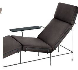
Frame: Black 5013 Fabric: Dark Brown F-521 (383) Tablet: Anthracite Grey