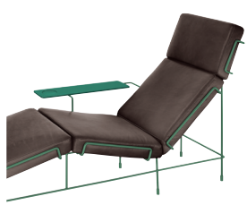
Frame: Dark Green 5021 Leather: Dark Brown L-0753 Tablet: Dark Green