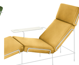
Frame: White 5011 Fabric: Yellow F-578 (453) Tablet: White