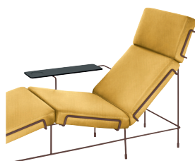
Frame: Sepia Brown 5016 Fabric: Yellow F-578 (453) Tablet: Anthracite Grey