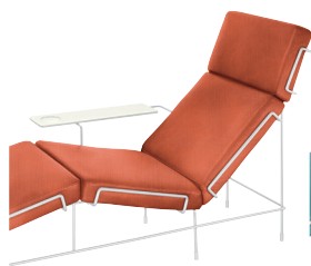
Frame: White 5011 Fabric: Orange F-088 (533) Tablet: White