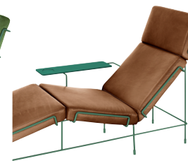
Frame: Dark Green 5021 Leather: Brown L-0112 Tablet: Dark Green