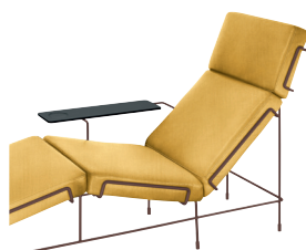
Frame: Sepia Brown 5016 Fabric: Yellow F-578 (453) Tablet: Anthracite Grey