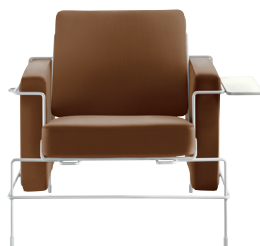
Frame: White 5011 Leather: Brown L-0111 Tablet: White