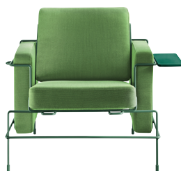
Frame: Dark Green 5021 Fabric: Green F-354 (953) Tablet: Dark Green