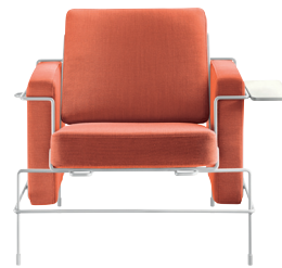
Frame: White 5011 Fabric: Orange F-088 (533) Tablet: White