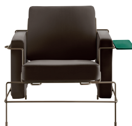
Frame: Mahogany Brown 5015 Leather: Dark Brown L-0752 Tablet: Dark Green