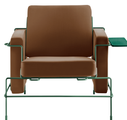
Frame: Dark Green 5021 Leather: Brown L-0111 Tablet: Dark Green