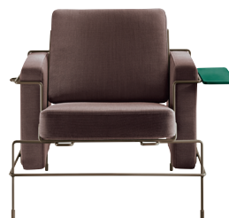
Frame: Mahogany Brown 5015 Fabric: Brown F-530 (353) Tablet: Dark Green