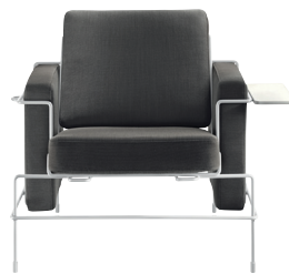
Frame: White 5011 Fabric: Black F-769 Tablet: White Chaise longue and Platform not for outdoor