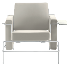
Frame: White 5011 Leather: Cream White L-0706 Tablet: White