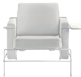
Frame: White 5011 Fabric: White F-737 Tablet: White Chaise longue and Platform not for outdoor