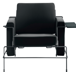
Frame: Black 5013 Leather: Anthracite Grey L-0060 Tablet: Anthracite Grey