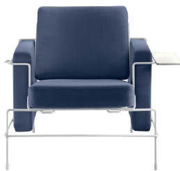
Frame: White 5011 Fabric: Blue F-257 Tablet: White Chaise longue and Platform not for outdoor