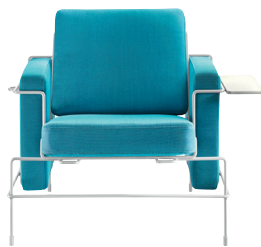
Frame: White 5011 Fabric: Turquoise F-227 Tablet: White Chaise longue and Platform not for outdoor