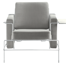
Frame: White 5011 Fabric: Light Grey F-741 (133) Tablet: White