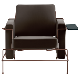
Frame: Sepia Brown 5016 Leather: Dark Brown L-0753 Tablet: Anthracite Grey