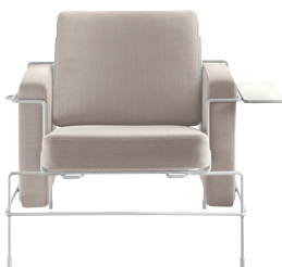
Frame: White 5011 Fabric: Beige F-266 (205) Tablet: White