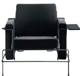
Frame: Black 5013 Leather: Anthracite Grey L-0065 Tablet: Anthracite Grey