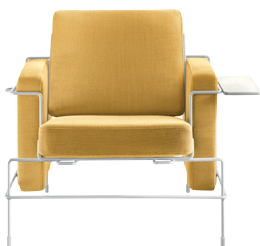
Frame: White 5011 Fabric: Yellow F-578 (453) Tablet: White