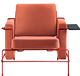
Frame: Signal Red 5019 Fabric: Orange F-088 (533) Tablet: Anthracite Grey

Les codes couleur Kvadrat sont indiqués entre parenthèses à côté du code couleur intérieur Magis. Les informations incluses dans cette fiche produit se basent sur les derniers données de notre tarif actuel. Magis se réserve le droit de modifier les produits sans préavis.