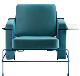
Frame: Green Blue 5017 Fabric: Light Blue F-222 (983) Tablet: White