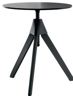
Frame: Beech stained Black Joint + Screw: Black 1754 Top: Black 8510