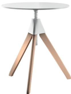
Frame: Natural Beech Joint + Screw: White 1735 C Top: White 8500