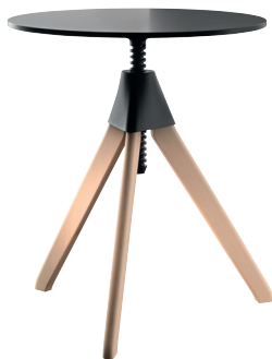
Frame: Natural Beech Joint + Screw: Black 1754 C Top: Black 8510