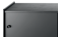
Frame: Anodised Black Aluminium Top: Stained Black Ash or MDF veneered Black Ash