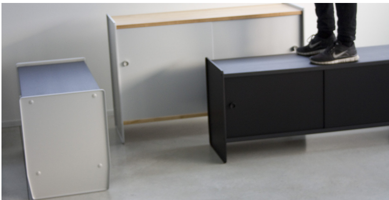
Designer bei Magis

traditionellen Wärme des Holzes zu schaffen. Die Typologie dieses Möbels ist in der Einrichtungsgeschichte vom 18. Jahrhundert bis hin zum skandinavischen Design tief verwurzelt und in perfektem Einklang mit dem zeitgenössischen Wohnen. Theca gibt es in zwei Höhen und zwei Breiten und wird so allen Platz- und Behältnisanforderungen gerecht.