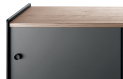
Frame: Anodised Black Aluminium Top: Natural Walnut or MDF veneered Natural Walnut