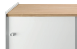
Frame: Anodised Aluminium Top: Natural Cherry or MDF veneered Natural Cherry