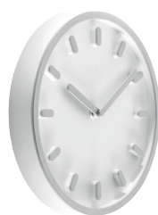
Matt colour Clock face: White 1735 C Hands, hour marks and frame: Grey 1737 C