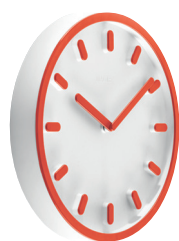
Matt colour Clock face: White 1735 C Hands, hour marks and frame: Orange 1086 C