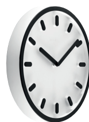
Matt colour Clock face: White 1735 C Hands, hour marks and frame: Black 1750 C