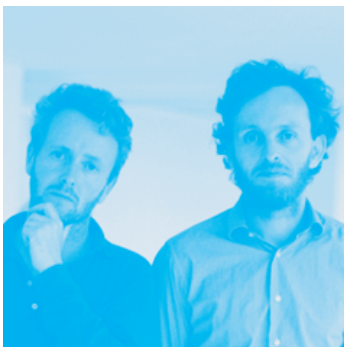
Ronan & Erwan Bouroullec

Ronan et Erwan Bouroullec s'associent il y a une quinzaine d'ans pour mener un travail au sein d'un dialogue permanent et d'une exigence commune vers plus de justesse et de délicatesse.