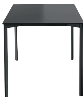
Frame: Black 5130 Top: Black 8510