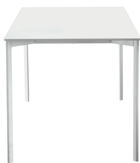
Frame: White 5108 Top: White 8500