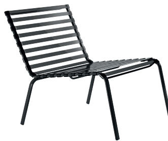
Frame: Black 5130 Slats: Smoke Grey 2017