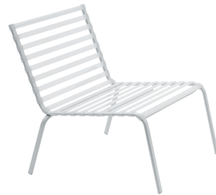
Frame: White 5108 Slats: White 2068