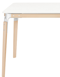
Frame: Natural Beech Joints + Tops: White 8500