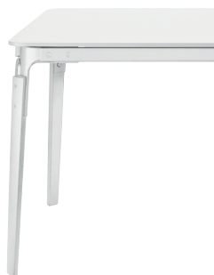
Frame: Beech painted White Joints + Tops: White 8500