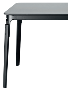
Frame: Beech painted Black Joints + Tops: Black 8510