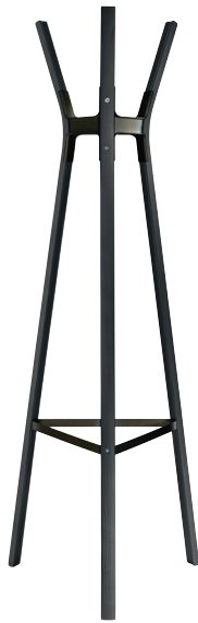
Finish Frame: Beech Painted Black Joints: Black 5140