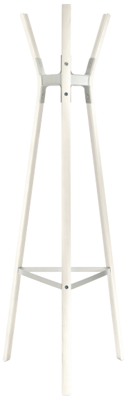
Finish Frame: Beech Painted White Joints: White 5108