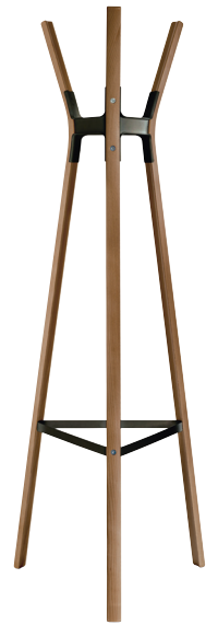
Finish Frame: American Walnut Joints: Black 5140