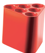
Glossy colours Orange 1088 C