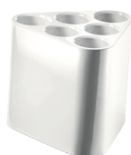
Glossy colours White 1673 C