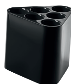
Glossy colours Black 1764 C