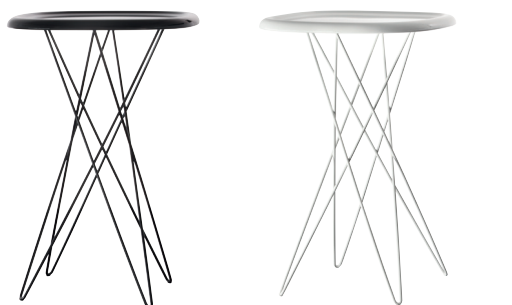
Colours Dark brown 1077 C